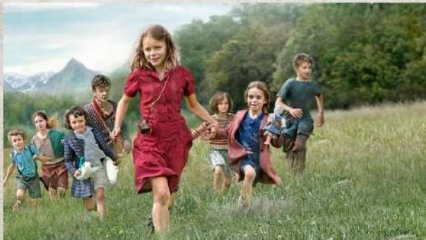
La classe 3C

"Il modo migliore di ricordare è rendersi conto di quanto si è fortunati ad avere il privilegio di vivere in pace"